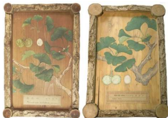
شکل ۳- دو نمونه چوب نقاشی شده با گونه Ginkgo biloba که در مجموعه باغ گیاه‌شناسی Koishikawa ژاپن نگهداری می‌شود. Figure 3. Two samples of the Ginkgo biloba painted species, keep in Koishikawa Botanical Garden, Japan.

برخی از نمونه‌های چوبی اولیه در کشور ژاپن و برخی نقاط دیگر (شکل ۳)، دارای تصاویر و نقاشی‌هایی از مجموعه‌های گیاهی بودند که اطلاعات نمونه گیاهی که با عنوان Illustrated Wood Sample شهرت داشت روی نمونه