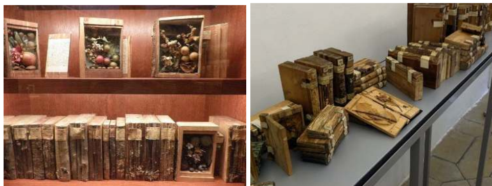
شکل ۲- نمونه‌هایی از Xylotheke Benedictine Abbey در Kremsmunster کشور اتریش (Garrett, 1999) Figure 2. Examples of the Xylotheke Benedictine Abbey in Kremsmunster, Austria (Garrett, 1999)