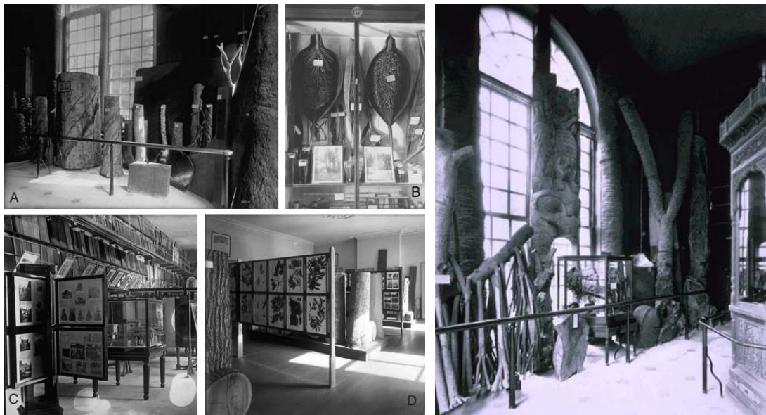
شکل ۱- تصاویر A تا D موزه چوب Orangery باغ Kew و اولین نمونه‌های چوبی آن Figure 1. Picture A to D, Kew Garden Orangery, the first wooden examples

با در نظر گرفتن تعریف موزه کلکسیون‌های چوبی اولیه در دنیا در ابتدا شامل وسایل و اجناس چوبی قدیمی و گرانبهائی بودند که در معرض دید عموم قرار می‌گرفت و در هرباریم‌ها و موزه‌ها نگهداری می‌شدند (Normand et al. , 2017). موزه چوب Orangery در باغ گیاه‌شناسی Kew (کیو) انگلستان و چوب‌های به نمایش گذاشته شده آن در