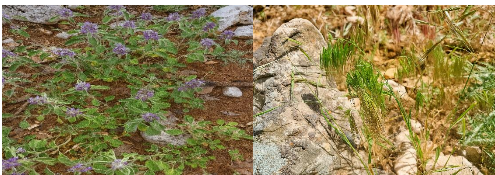
شکل ۲- گونه‌های Bromus tectorum L. (راست) و Marrubium astracanicum Jacq. (چپ) در منطقه مورد مطالعه