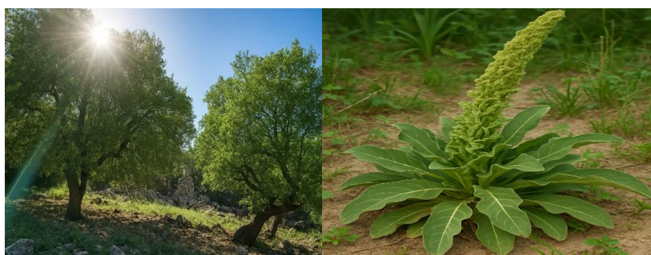
شکل ۳- گونه Verbascum alceoides Boiss. & Hausskn. (راست) و نمایی از توده دانه‌زاد در جنگل مورد مطالعه (چپ)