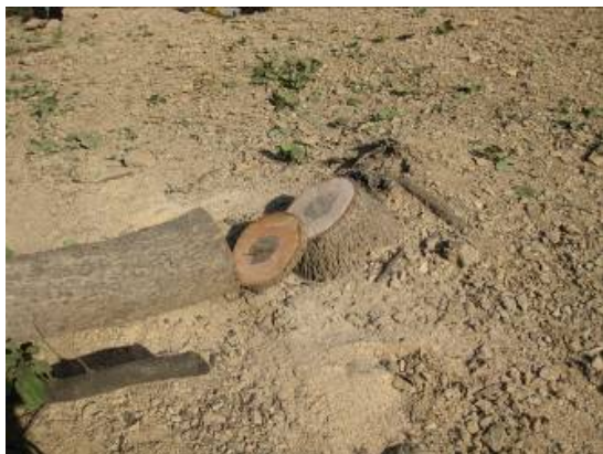
شکل ۲- تهیه نمونه دیسک به ضخامت ۵ سانتی متر از محل کنده

تنه (Bole): در نمونه برداری از تنه، دو دیسک تهیه شد: نمونه دیسک به ضخامت ۵ سانتی متر از ارتفاع برابر سینه نمونه دیسک به ضخامت ۵ سانتی متر از محل کنده (شکل ۲)