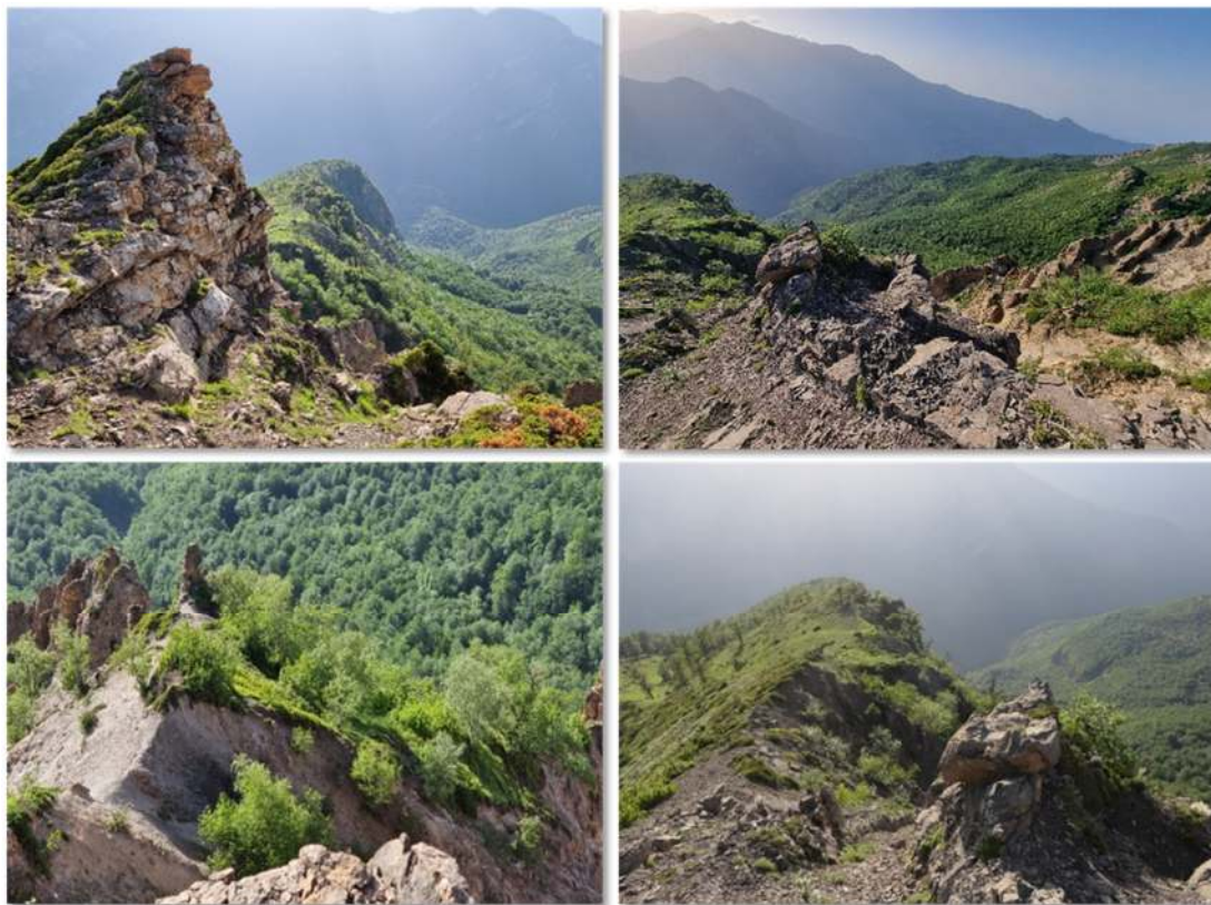
شکل ۲- رویشگاه توس در منطقه کنگله‌چال (دریاسر)

شرقی‌ترین رویشگاه توس در منطقه سیاه‌مرزکوه در دره محمدآباد (فاضل‌آباد) استان گلستان واقع شده است. رویشگاه دودانگه ساری در سطح وسیع‌تری در دیواره‌های کوه‌های صخره‌ای و پیوسته دودانگه-چهاردانگه ساری قرار دارد. لسی‌کوه در دره هراز (محدوده جاده بلده) از رویشگاه‌های جالب و گسترده و با وسعت قابل‌توجه پس از رویشگاه دودانگه است که بر روی دامنه‌های واریزه‌ای کوه‌های بالاتر از ۲۷۰۰ متری منطقه با درختانی قطور و کهن‌سال مستقر شده است. در منطقه البرز مرکزی و در ارتفاعات سیاه‌بیشه در دره چالوس که تا پیش از این گزارش، غربی‌ترین دامنه انتشار توس در هیرکانی بود، این گونه فقط در دو منطقه شامل دریاپک و ارتفاعات اولابا وضعیتی نامناسب و رو به نابودی انتشار دارد. پژوهش‌های Browicz (۱۹۷۲)، Browicz و Zielinski (۱۹۸۲) و Zare (۲۰۰۲ و ۲۰۱۵) در رابطه با رویشگاه‌های توس در