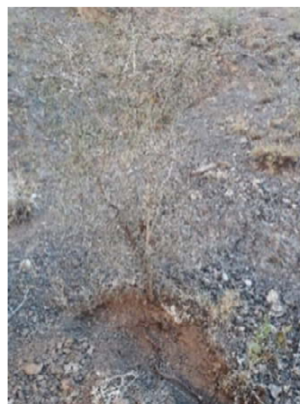
شهرستان خوی (دره قطور) Khoy county (Ghatour valley)

شکل ۳- مقایسه رشد گونه بادام کوهی در خوی و نوشهر