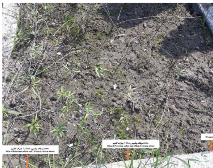
شهرستان نوشهر (باغ گیاه‌شناسی) Nowshahr county (Botanical Garden)

Means followed by similar letters do not differ significantly in the LSD multi-domain test ( P < 0.05 ).