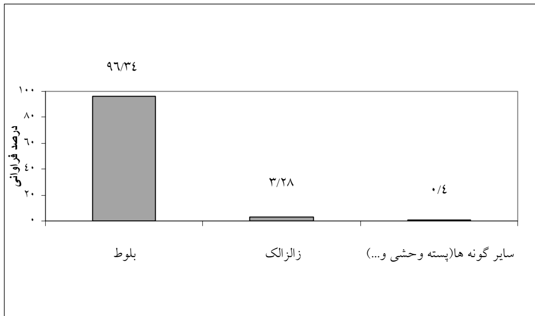
شکل ۳- درصد فراوانی گونه‌ها در آماربرداری صددرصد جنگل