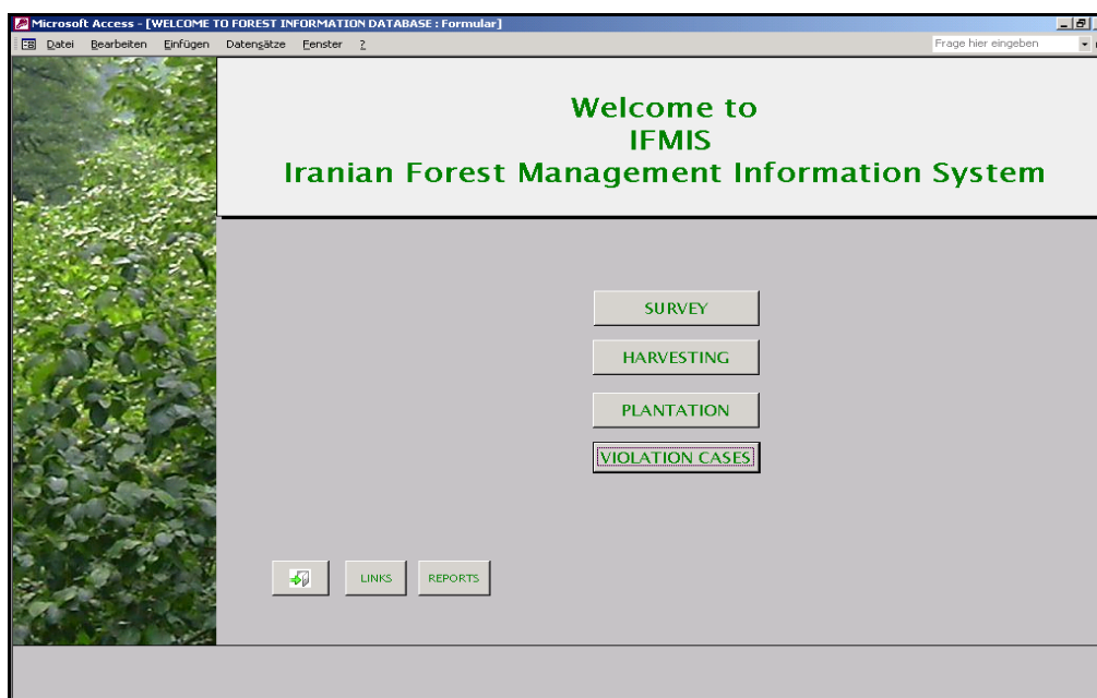
شکل ۱- صفحه ورودی به سیستم

کدهای حوضه آبخیز، سری، پارسل و همچنین مختصات و کدهای قطعات نمونه است که سبب می‌شوند بتوان اطلاعات و داده‌های آماربرداری را به سامانه اطلاعات جغرافیایی (GIS) منتقل کرد.