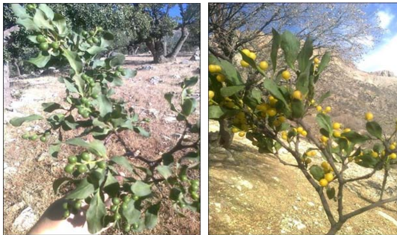
شکل ۴- نمائی از کپه‌های موخور قبل و بعد از رسیدن میوه‌های آن