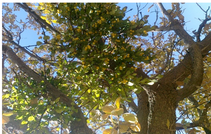
شکل ۵- نمایی از کپه موخور در فصل پاییز، میوه‌ها به‌طور کامل رسیده و به رنگ زرد درآمده‌اند.