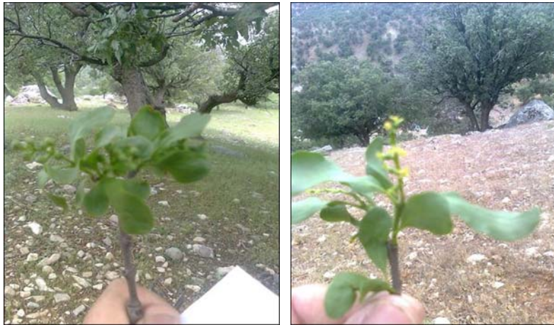
شکل ۳- نمائی از کپه‌های موخور قبل و بعد از شکوفه‌دهی گل‌های آن