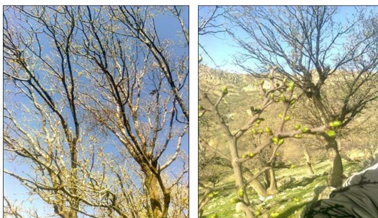
شکل ۲- نمایی از کپه‌های موخور قبل از باز شدن برگ‌های آن