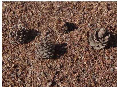
شکل ۳- مواد به دست آمده از خرد شدن مخروط کاج در خرمنکوب با تیغه لبه صاف (راست): مواد خردشده در کنار مواد اولیه؛ چپ: مقایسه هسته کاج خردنشده مخروط کاج سالم)

شد. مواد کمی که به صورت خردنشده در محفظه خردکن باقی ماند، هسته چوبی مخروط کاج بود که حدود ۱۰ درصد حجم مخروط اولیه را شامل می شد (شکل ۴).