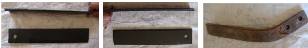
شکل ۲- طراحی و ساخت تیغه‌های جدید برای نصب روی خرمکوب (راست: تیغه قدیمی؛ وسط: تیغه لبه صاف جدید؛ چپ: تیغه لبه تیز جدید)

برای تهیه تیغه‌های جدید دو نوع تیغه لبه صاف و لبه تیز از تسمه فولاد فتر که از استحکام، دوام و مقاومت مناسبی در مقابل سایش برخوردار است، انتخاب و طراحی شد. همچنین هر تیغه توسط یک پیچ و مهره به‌گونه‌ای روی