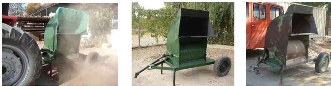
شکل ۱- مراحل بازسازی خرمکوب (راست: پیش از بازسازی؛ وسط: پس از بازسازی؛ چپ: در حال کار)

محور تیغه‌ها نصب شد که تیغه نسبت به محور حالت لولایی داشته باشد تا در زمان کار و برخورد با اجسام سخت بتواند بدون اعمال نیروی زیاد و صدمه دیدن از آن عبور کند، بنابراین نقشه‌های فنی تیغه‌ها تهیه شد و برای ساخت به کارگاه تولید سفارش داده شد (شکل ۲).