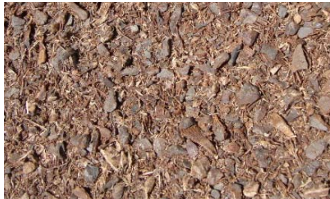
شکل ۴- مواد به دست آمده از خرد شدن مخروط کاج در خرمنکوب با تیغه لبه تیز (راست): مواد خرد و خارج شده از خرمنکوب؛ چپ: مقایسه هسته کاج خردنشده و مخروط کاج سالم)

خارج شد. مواد اولیه یکنواخت نبود و اندازه مواد خروجی ناهمگون بود. گیاهان علفی بسیار نرم خرد شدند. در ۹۵ ثانیه اول، خرد شدن و خروج مواد با شدت زیادی انجام شد. اندازه مواد خروجی ناهمگون بود. خرد شدن سوزن کاج بسیار نرم انجام شد که در ۹۸ ثانیه اول مواد بیشتری از خرمنکوب خارج شد. اندازه مواد خروجی تقریباً همگون بود.