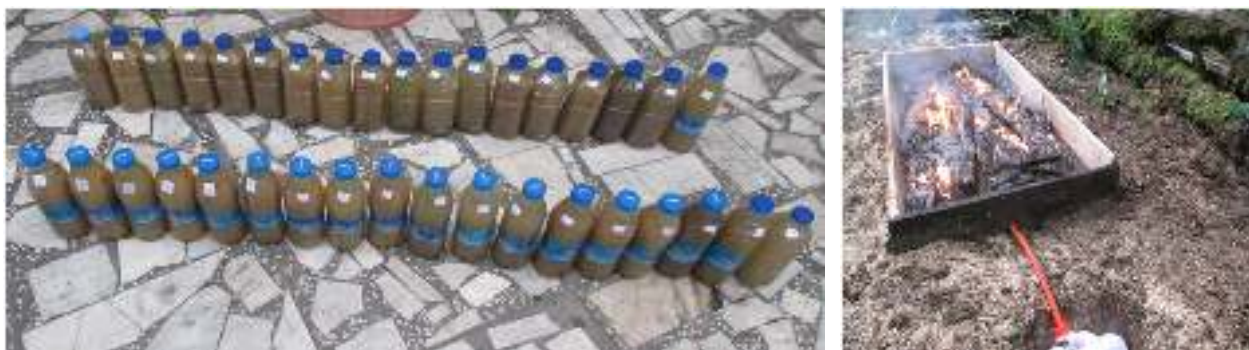
شکل ۱- نحوه استقرار قطعه نمونه‌ها و جمع‌آوری نمونه‌های آب برای اندازه‌گیری کیفیت رواناب

صد درصد شد (Granged et al. , 2011). همه گونه‌های علفی و نونهال موجود در قطعه نمونه‌ها در ابتدا و انتهای هر فصل شمارش شد. همچنین، سطحی از قطعه نمونه که توسط پوشش گیاهی پوشیده شده بود، به صورت درصد نسبت به سطح قطعه نمونه برآورد شد.