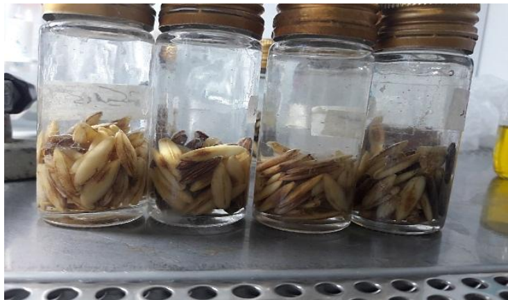
شکل ۱- نمایان شدن جنین بذرها پس از قرار گرفتن در محلول هیپوکلریت سدیم یک درصد

فشار کم در قسمت پایین بذر از پوسته خارج شد. جنین‌ها یک دقیقه در الکل ۷۰ درصد غوطه‌ور شدند و سپس سه بار با آب مقطر سترون شسته شدند. جنین‌های شسته‌شده روی کاغذ صافی استریل منتقل شدند. سپس از هر منطقه، پنج بذر در محیط کشت MS، WPM و Monier قرار داده شد. کشت جنین‌ها در محیط‌های کشت در سه تکرار انجام شد که در مجموع ۱۵ بذر از هر منطقه (۶۰ بذر در چهار منطقه)