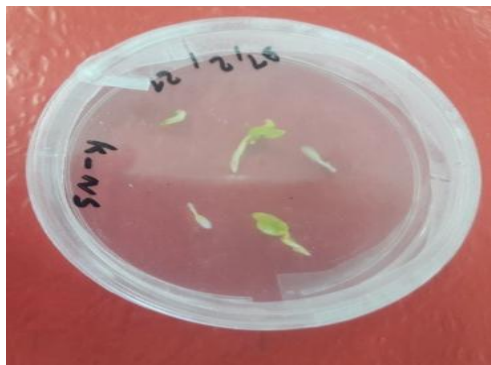
شکل ۲- جنین‌های سبزشده در محیط کشت