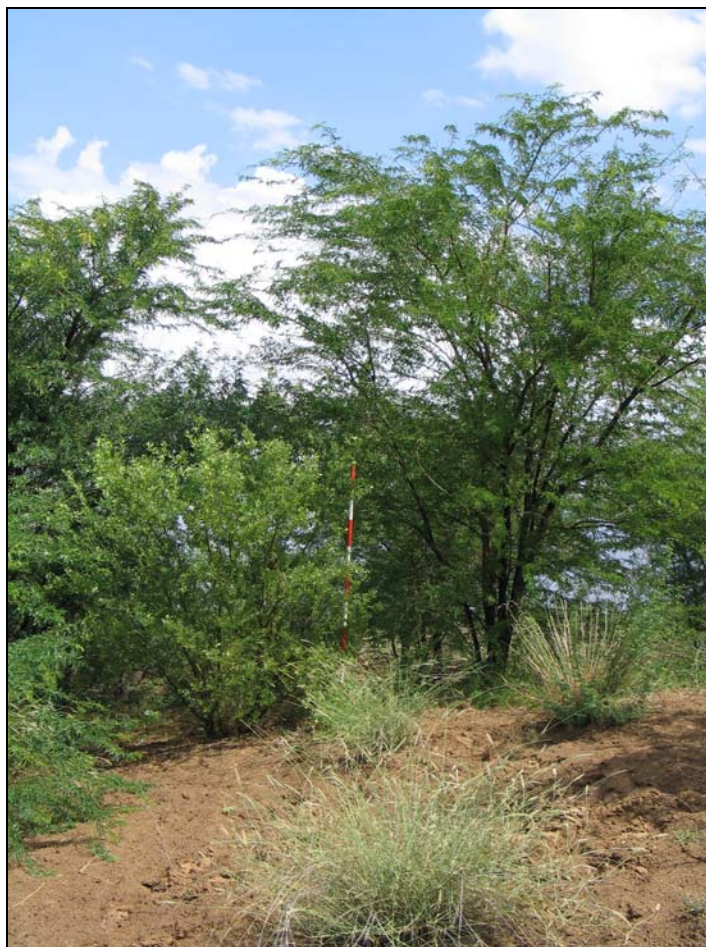
شکل ۲- وضعیت رشد و چیرگی تاج پوشش گونه P. juliflora در کشت آمیخته با گونه A. victoriae در فواصل سه متری (دی ماه، ۱۳۸۵)

از سرشاخه‌ها باشد، می‌توان فواصل کاشت گونه‌ها را کاهش داد که این امر سبب افزایش زیست‌توده علفی خواهد شد. در بررسی که توسط Singh (2009) در مورد تأثیر فاصله کاشت بر عملکرد علوفه‌ای Prosopis juliflora در سن شش سالگی در هندوستان انجام شد، نتایج نشان داد که عملکرد علوفه با فاصله کاشت رابطه معکوس داشته، به طوری که بیشترین عملکرد علوفه در فواصل ۲×۲ متر با ۴۹/۱ تن در هکتار مشاهده شد و کمترین عملکرد به فواصل ۴×۴ متر با ۲۵ تن در هکتار اختصاص داشته است. میزان زیست‌توده خشبی رابطه مستقیمی با فاصله کاشت داشت، به طوری که در فواصل بیش از ۴ متر سبب افزایش مقدار چوب گردید که چوب